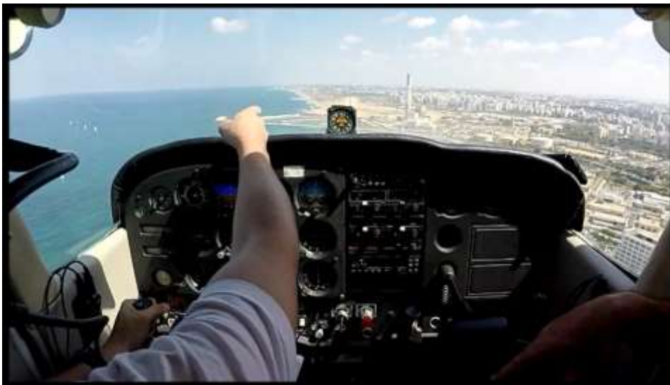
מבט ממטוס הצסנה לעבר המסלול בנקודת זיהוי האמברייר המתיישר